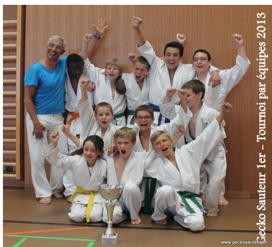
Tournoi écoliers par équipes

Nous restons à votre entière disposition.