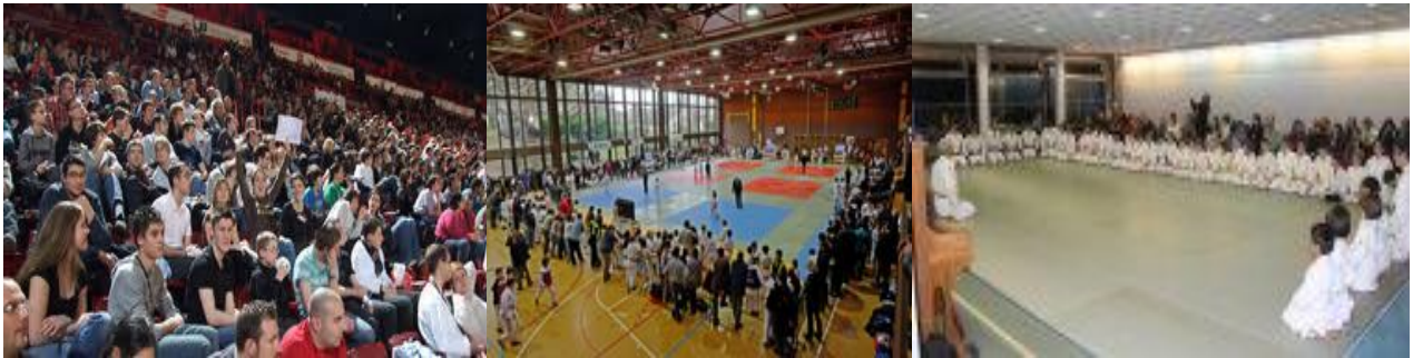
Tournoi international, France