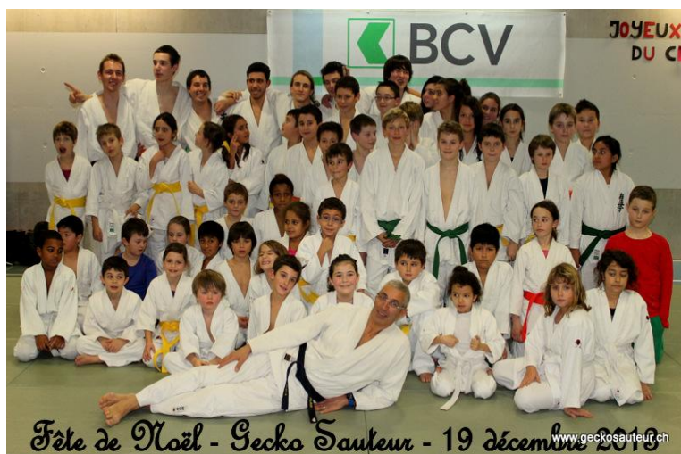
Equipe du Gecko Sautteur