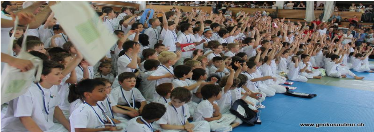
Open d'été Judo Wakate à Lausanne