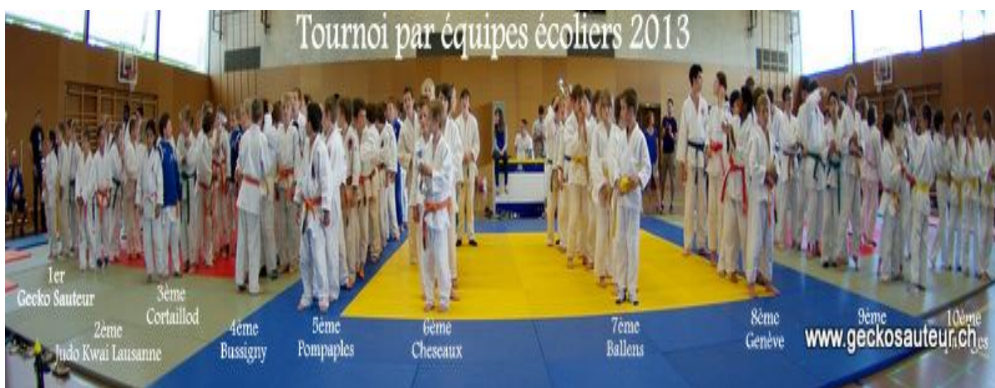
Tournoi par équipes écoliers – Victoire du Gecko Sauteur

Ce partenariat serait un signe fort, à la fois de sérieux, de solidarité et de générosité de votre part, que vos clients et collaborateurs sauront apprécier à sa juste valeur.